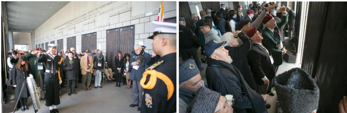
Au musée de la guerre de Corée à Séoul figurent également sur des plaques de bronze tous les noms des soldats des forces de l'ONU morts pendant le conflit de 1950 à 1953. La plaque des soldats français se situe à proximité de celle des canadiens

Pendant ce court séjour, nous avons fait la connaissance à Busan du premier secrétaire de l'ambassade de France et nous avons aussi eu le grand plaisir de rencontrer à Séoul à deux reprises l'attaché de défense près de la république de Corée du Sud. Nous avons parlé ensemble de l'ANAAFF/ONU/BC&RC/156 ème RI qui perpétue le souvenir du Bataillon Français de Corée en France et en Corée, et de la qualité exceptionnelle des relations de la France avec le pays du matin calme. Ils nous ont en particulier assuré que notre industrie de défense, qui possède un haut degré technologique, permet à notre pays de tenir son rang dans cette région du monde. Notre déplacement en KTX ( Korea Train eXpress ) entre Séoul et Busan nous a également démontré que la technologie française est bien une réalité hors de nos frontières.