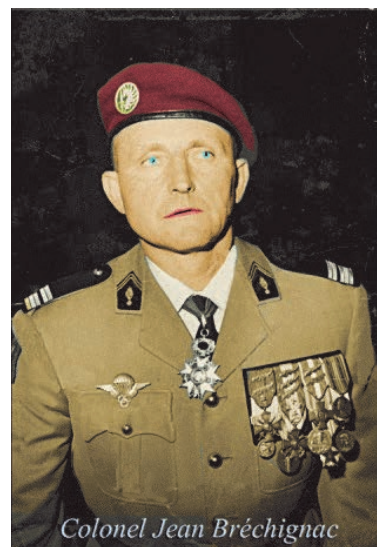
Colonel Jean Bréchignac

Ses paras du 1 er RCP « troupes fraîches », vont vite fondre dans la bataille. Les compagnies se réduisent bien vite à quelques dizaines d'hommes commandés par des sous-lieutenants. Les positions sont submergées les unes après les autres. Et, pire encore que l'enfer du combat, ce sera l'enfer de la captivité.