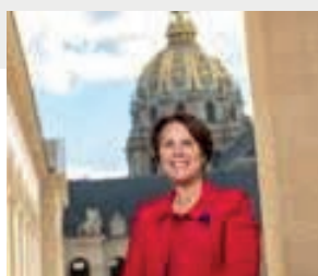
Ce n'est qu'un au-revoir.