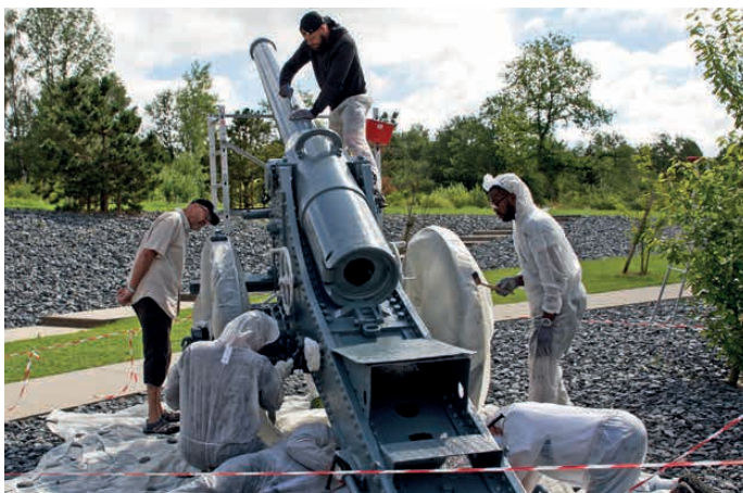
La restauration d'un canon au mémorial de Verdun

Pour aider ces blessés à identifier dans le temps de nouveaux repères nécessaires à la définition de leur projet de vie, Ad Augusta, en lien avec l'Institution militaire et le Service de Santé des Armées, va leur permettre d'évoluer dans des environnements choisis pour leur caractère apaisant notamment la mer et la campagne. Commence alors un travail individualisé, destiné à les préparer à intégrer d'abord un stage de formation initiale, étape indispensable avant d'intégrer des projets associatifs adaptés.