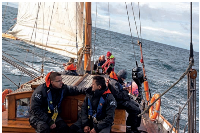
Une traversée de la Manche en voilier pour se retrouver.

Dans les deux cas, cette personne a besoin de l'aide répétée d'un médecin spécialiste qui la traite par une médication adaptée doublée d'un processus de dissociation