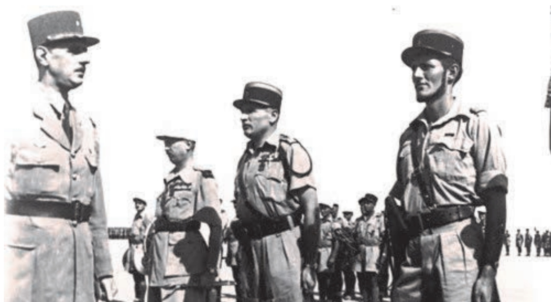
1942 Après Bir Hakeim remise de décorations par le Général De Gaulle à Koenig, Amilakvari et De Sairigné.