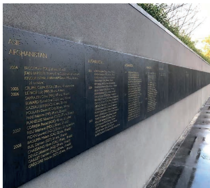
Pas qu'une sculpture, un mur.....!